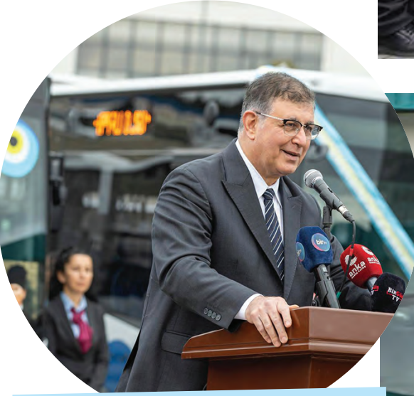
Dr. Cemil Tugay

Yeni mavi renkli otobüslere, İzmirli için şans ve güveni simgelemesi adına "Nazar Boncuğu Otobüsleri" adı verildi. Filo genişleme töreninde konuşan İzmir Büyükşehir Belediye Başkanı Dr. Cemil Tugay, merkezi yönetimden toplu taşımada ÖTV ve KDV muafiyeti talep etti. Tugay, "Toplu taşıma hizmeti sunmamıza rağmen ÖTV ve KDV'den muaf değiliz, oysa yalnızca akaryakıt vergisine ödediğimiz tutarla her yıl 125 yeni otobüs alabiliriz" dedi.